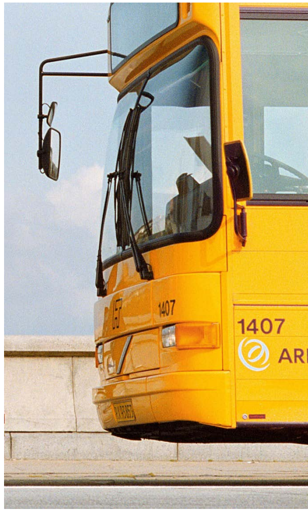
1/3 KOLLEKTIV TRAFIK